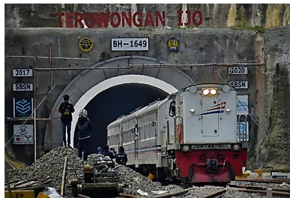
Gambar 2. Terowongan Kereta Api

Jembatan kereta api memiliki merupakan kumpulan baja, beton, dan struktur lain yang menghubungkan tepian sungai, jurang dan keperluan lalu lintas kereta api lainnya. Pada umumnya konstruksi jembatan dibagi menjadi dua bagian yaitu konstruksi jembatan bagian atas dan konstruksi jembatan bagian bawah. Konstruksi jembatan bagian atas merupakan konstruksi jembatan itu sendiri yang memiliki fungsi menghubungkan satu tempat dengan tempat lainnya. Sedangkan konstruksi jembatan bagian bawah antara lain meliputi pangkal, pilar dan pondasi. Sistem jembatan harus memenuhi beberapa persyaratan antara lain: