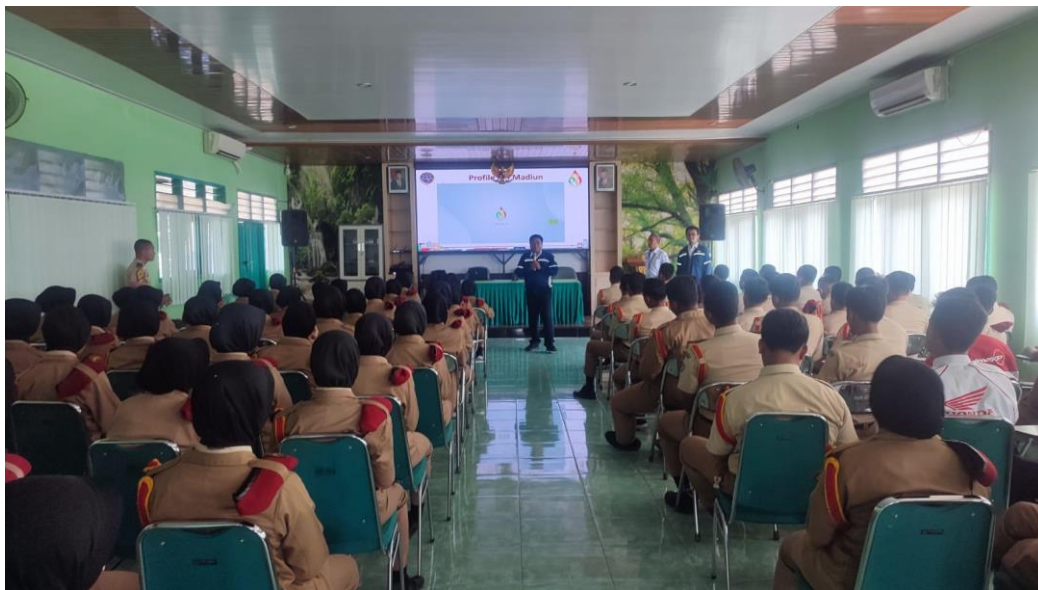
Gambar 2. Suasana pelaksanaan Sosialisasi Keselamatan Perkeretaapian

Gambar 1 dan 2 suasana pelaksanaan sosialisasi keselamatan perkeretaapian di depan siswa. Sangat penting untuk menciptakan suasana yang edukatif, interaktif, dan memotivasi. Berikut adalah beberapa langkah dalam melaksanakan sosialisasi ini[7]: