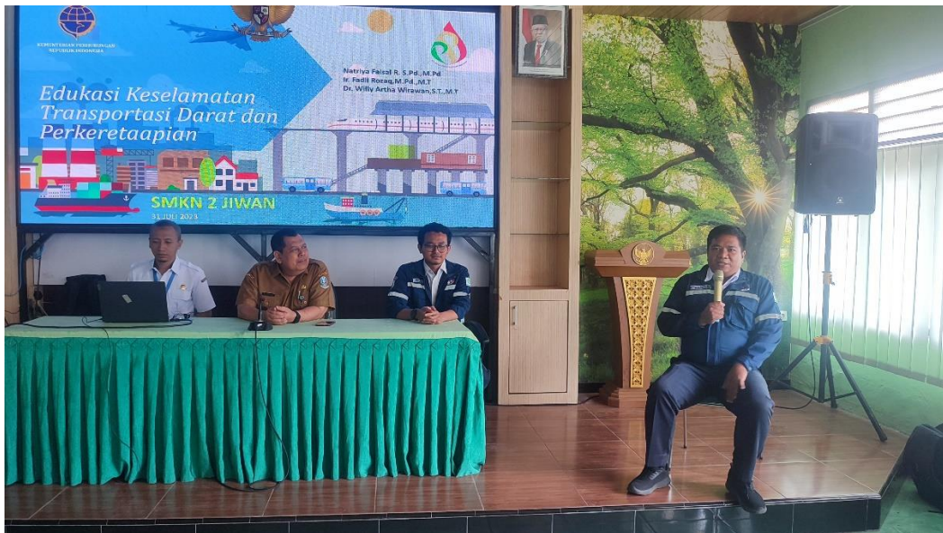
Gambar 1. Suasana pelaksanaan Sosialisasi Keselamatan Perkeretaapian