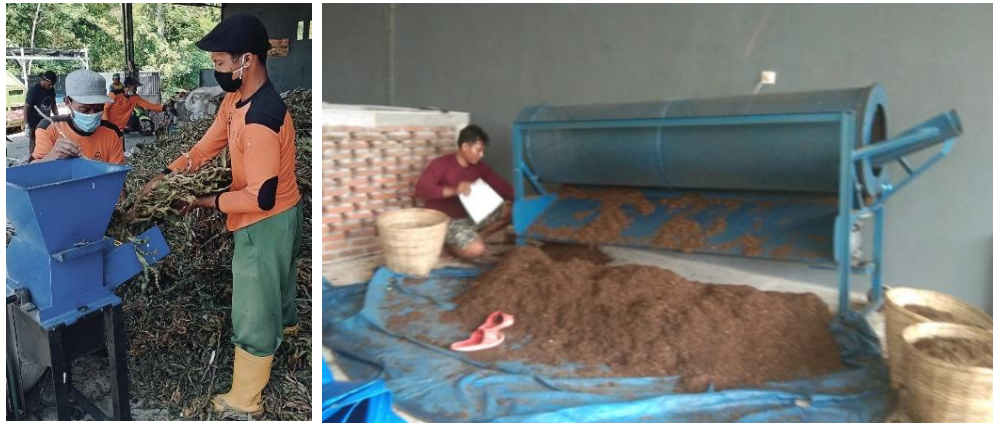
Gambar 5. Daur ulang menjadi serbuk