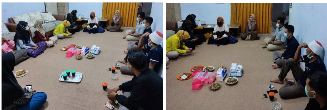
Gambar 2. Kegiatan penyuluhan dan pelatihan

Informasi ini mencakup jenis bahan daur ulang yang bisa digunakan serta alat-alat sederhana yang diperlukan dalam proses pembuatan. Pelatihan akan dilanjutkan dengan panduan langkah demi langkah untuk membuat braket dari bahan daur ulang, memastikan peserta dapat mengikuti dan mempraktikkan proses tersebut dengan mudah (Sari et al., 2023). Dengan mengikuti pelatihan ini, peserta diharapkan dapat membuat produk bermanfaat dari bahan daur ulang, sekaligus mengurangi jumlah sampah yang dihasilkan.