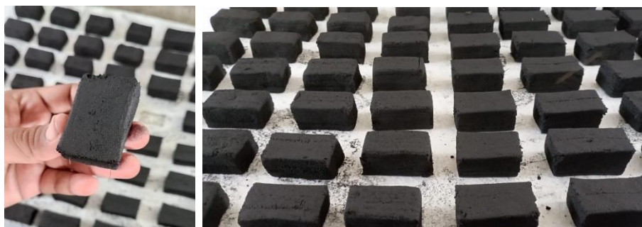
Gambar 3. Contoh briket yang sudah jadi

Instruktur memulai sesi dengan menunjukkan contoh briket yang telah selesai dibuat pada gambar 3, menjelaskan fungsi serta aplikasinya. Instruktur menggambarkan bagaimana briket ini dapat digunakan sebagai sumber energi alternatif yang ramah lingkungan dan ekonomis.