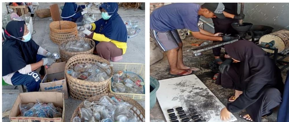
Gambar 4. Proses pembuatan briket plastik

Selanjutnya, instruktur memandu peserta melalui proses pembuatan briket dengan menunjukkan langkah demi langkah secara langsung, mulai dari pemilihan bahan daur ulang yang tepat hingga tahap finishing seperti gambar 4. Selama demonstrasi, instruktur memberikan penjelasan detail mengenai setiap langkah, memastikan peserta memahami proses tersebut dengan baik. Ia juga menyisipkan tips praktis untuk mengoptimalkan hasil pembuatan briket, membantu peserta menghindari kesalahan umum dan meningkatkan efisiensi. Melalui pendekatan ini, peserta diharapkan dapat memperoleh keterampilan yang dibutuhkan untuk membuat briket secara mandiri.