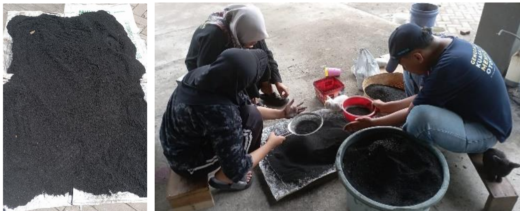
Gambar 6. Serbuk disaring sebelum diolah

Masukkan campuran serbuk yang sudah disaring seperti gambar 6, kertas bekas yang telah direndam dan dihancurkan, serta serbuk arang ke dalam ember atau wadah besar. Tambahkan air secukupnya untuk membuat adonan yang mudah dibentuk. Tambahkan perekat alami seperti tepung kanji untuk membantu mengikat bahan.