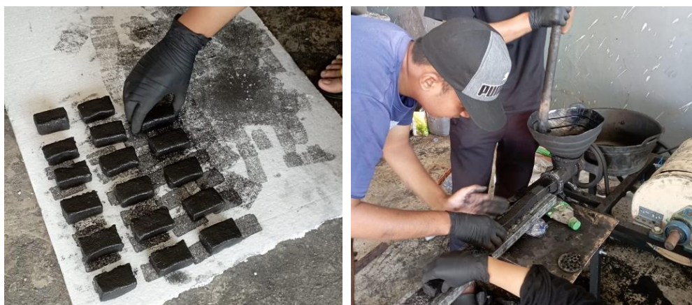
Gambar 7. Proses cetakan briket dan proses peletakan serta pengeringan briket