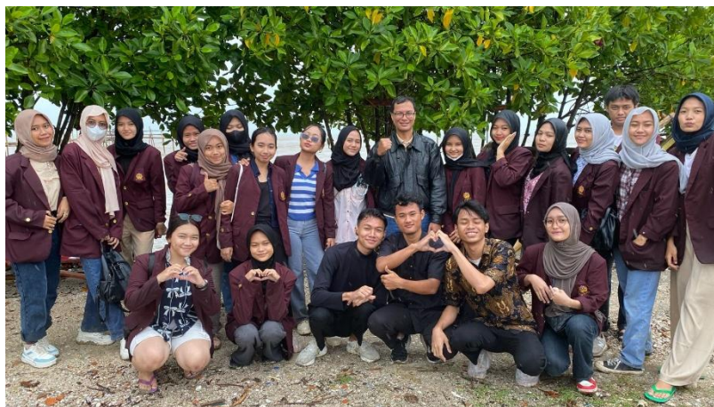
Gambar 2. Tim pengabdian beserta para mahasiswa di lokasi kegiatan pengabdian

Setelah dilakukan pengarahannya dan berdoa, tim pengabdian bersama para mahasiswa berangkat menuju Desa Pasirjaya, Kecamatan Cilamaya Kulon, dengan menempuh waktu kurang lebih 1,5 sampai 2 jam perjalanan. Mahasiswa juga diberikan kesempatan untuk mengisi bahan bakar terlebih dahulu dengan jumlah yang cukup, mengingat perjalanan menuju lokasi pengabdian berjarak cukup jauh.