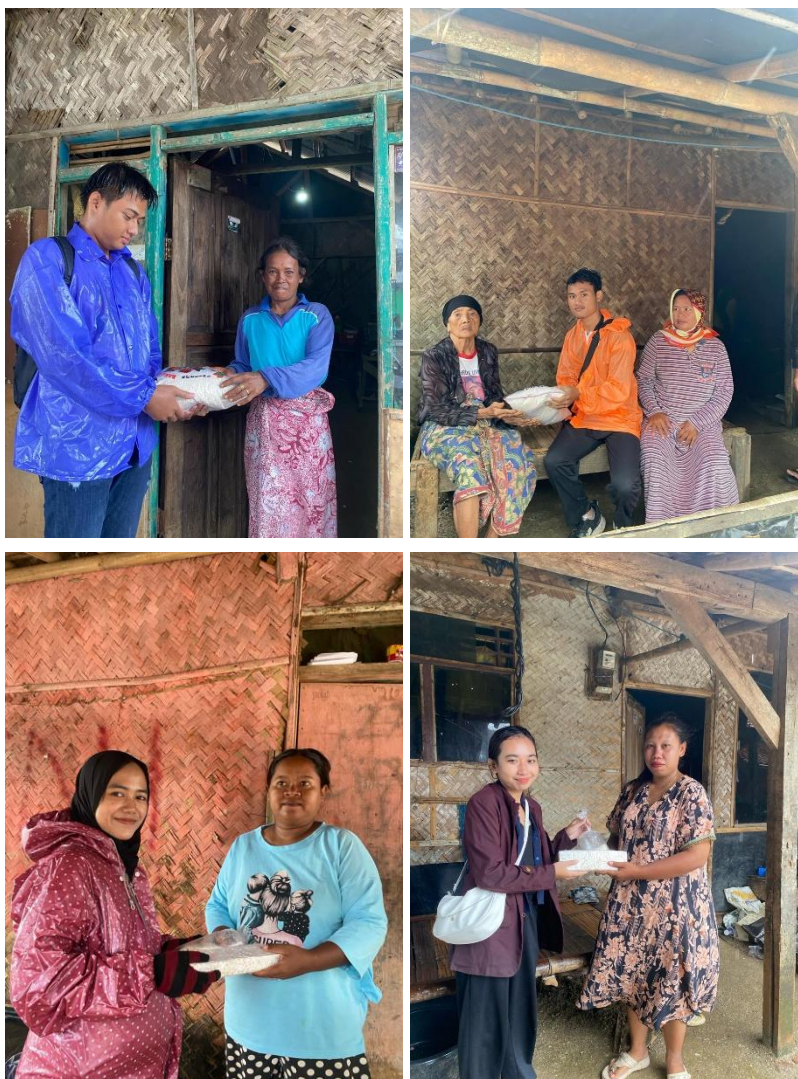
Gambar 3. Para mahasiswa menyampaikan bantuan kepada masyarakat Kampung Tanjungbaru, Desa Pasirjaya

semangat menyalurkan bantuan kepada masyarakat Kampung Tanjungbaru, berupa beras dan bahan makanan lainnya (Gambar 2). Walaupun jumlah bantuan yang dibawa tim pengabdian beserta mahasiswa tidak banyak, namun sudah cukup bagi tim pengabdian untuk memberikan pesan secara tidak langsung kepada para mahasiswa tentang pentingnya kepedulian kepada masyarakat miskin di wilayah pelosok Kabupaten Karawang, termasuk di desa tersebut.