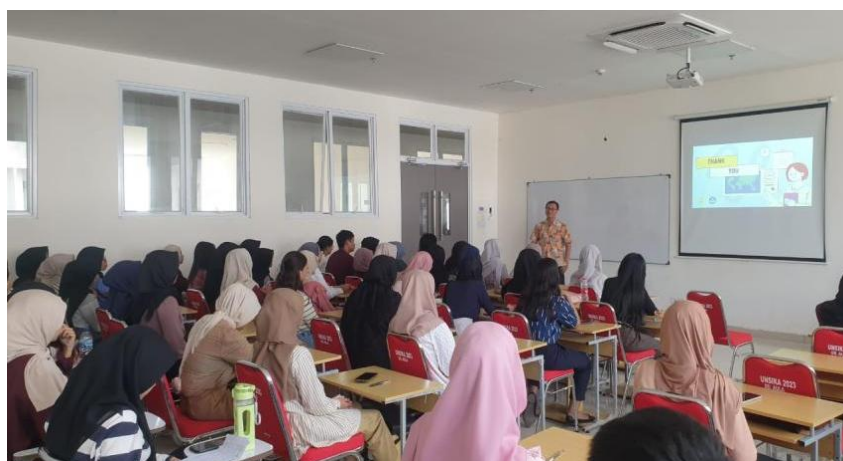
Gambar 3. Koordinator tim pengabdian menyampaikan kata sambutan sekaligus membuka acara

Peluang kerja dalam profesi Akuntan Publik sangat terbuka lebar, oleh karena minat yang relatif kecil dari lulusan Strata 1 Akuntansi. Berdasarkan sumber yang sama, hanya 0,26% lulusan Strata 1 Akuntansi di Indonesia (sebanyak 35 ribu orang per tahun) yang menekuni profesi sebagai Akuntan Publik, atau 1 : 372. Artinya, dari sebanyak 372 orang lulusan Strata 1 Akuntansi, hanya satu orang yang berprofesi sebagai Akuntan Publik. Rata-rata jumlah Akuntan Publik baru per tahun selama kurun 2021 sampai 2024 sebanyak 50 Akuntan Publik.