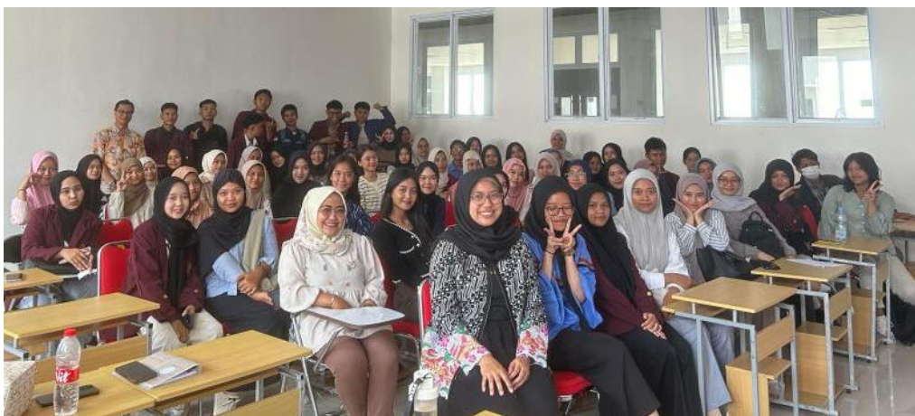
Gambar 2. Tim pengabdian berfoto bersama dengan para peserta sosialisasi

Sosialisasi pengenalan profesi di bidang Akuntansi ini diselenggarakan pada hari Selasa, tanggal 26 November 2024, berlokasi di lantai 4, Kampus 2 Universitas Singaperbangsa Karawang. Kegiatan ini diikuti oleh 59 mahasiswa Jurusan Akuntansi, Fakultas Ekonomi dan Bisnis, Universitas Singaperbangsa Karawang, baik berasal dari Program Studi Diploma 3 maupun Strata 1 Akuntansi (Gambar 2). Kegiatan tersebut berlangsung mulai pukul 07.30 sampai 09.00 WIB.