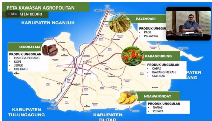
Gambar 3. Desain kawasan wilayah agropolitan Kabupaten Kediri

Desain Kawasan Wilayah (DEKAWIL) menjadi konsep pertama dari kebijakan Mas Dhito selaku Bupati Kediri untuk melihat secara seksama terkait potensi-potensi apa saja yang ada di Kabupaten Kediri. Tujuan dari desain kawasan wilayah adalah melihat zona-zona mana saja yang memiliki potensi pertanian, perkebunan, potensi alam, dan sumber daya alam (SDA) yang ada di Kabupaten Kediri. Hal ini didukung dengan ilustrasi gambar sebagai berikut.