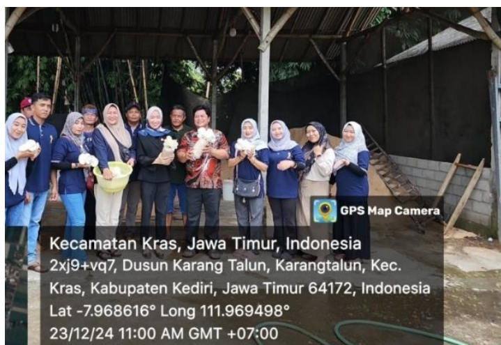
Gambar 5. Dampak signifikan dari budidaya jamur tiram