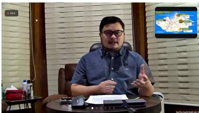
Gambar 4. Paparan tentang strategi Bupati Kediri