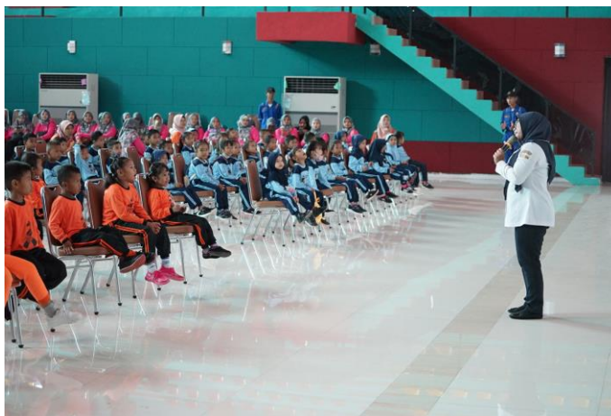
Gambar 5. Pemberian materi pengetahuan umum perkeretaapian

Indonesia Madiun. Penyampaian materi diusahakan dengan suasana dan kondisi yang menyenangkan.