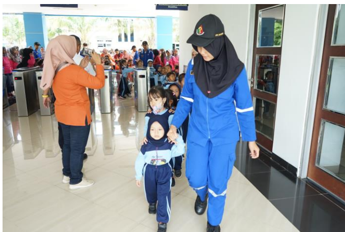
Gambar 6. Mengenalkan profesi-profesi di bidang perkeretaapian

Beberapa profesi di dunia kereta api diminati anak-anak. Profesi ini dilihat menarik karena berhubungan dengan kereta api. Beberapa profesi tersebut diantaranya masinis dan PPKA. Beberapa taruna Politeknik Perkeretaapian Indonesia Madiun dilibatkan untuk membantu dalam menjelaskan lebih detail mengenai profesi-profesi tersebut.