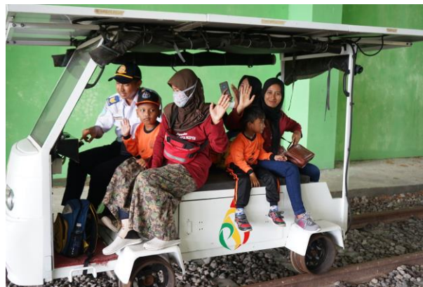
Gambar 9. Mengajarkan etika dan tata cara naik kereta api

Pemberian materi mengenai tatacara dan etika naik kereta api diberikan sambil naik kereta api. Hal ini dimaksudkan untuk memudahkan pemahaman anak-anak tentang etika dan tatacaranya.