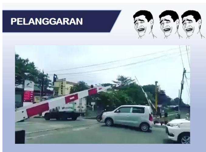
Gambar 4. Pelanggaran umum di bidang perkeretaapian

Beberapa peraturan umum dan pelanggaran yang terjadi di bidang perkeretaapian antara lain: