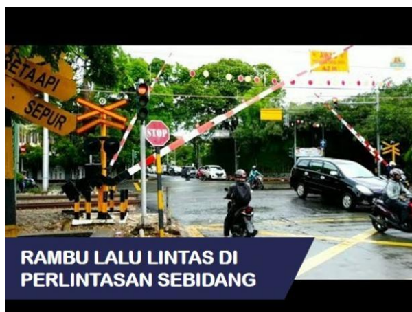
Gambar 2. Rambu perlintasan kereta api