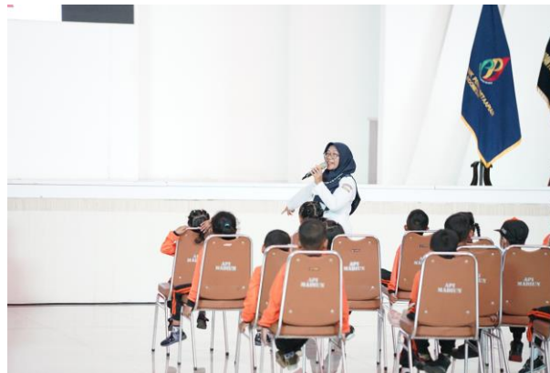
Gambar 7. Pemberian materi mengenai peraturan umum bidang perkeretaapian