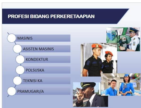
Gambar 3. Profesi bidang perkeretaapian