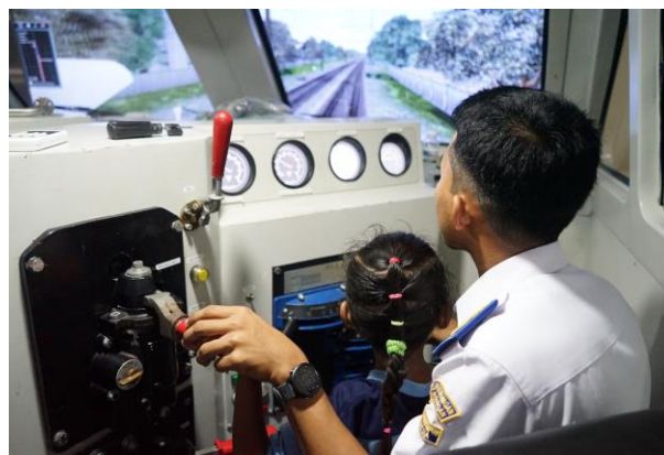
Gambar 8. Pengalaman naik kereta api

Pengalaman naik kereta api di lingkungan Politeknik Perkeretaapian Indonesia Madiun merupakan sesi yang paling ditunggu oleh anak-anak. Pengalaman naik kereta api ini dapat juga sambil mereviu materi pengetahuan umum sekitar kereta api.