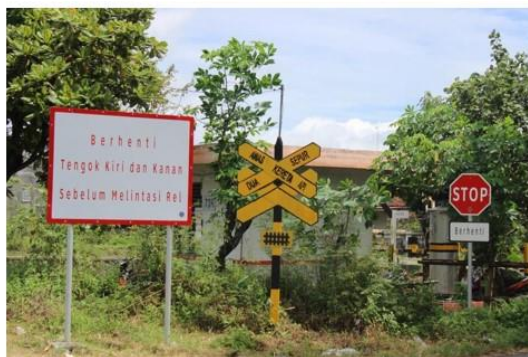
Gambar 1. Perlengkapan perlintasan kereta api