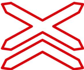
Gambar 2. Perlintasan kereta api jalur ganda