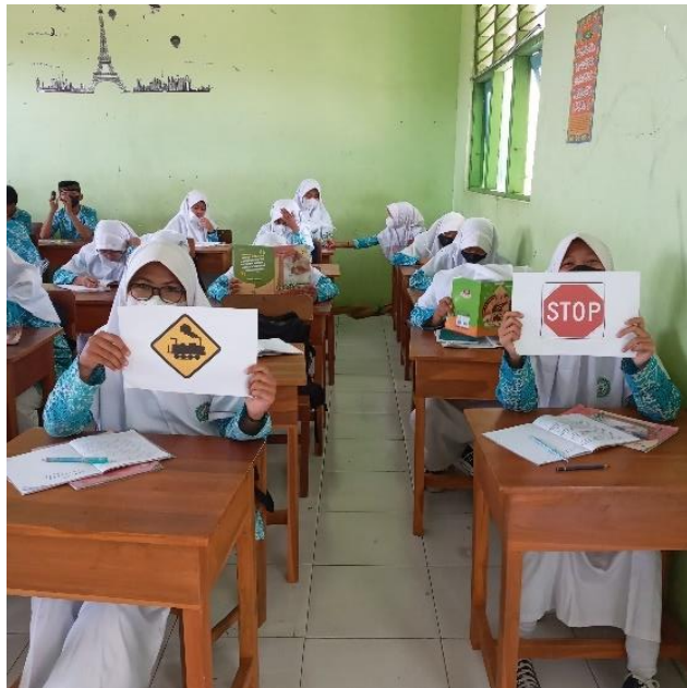
Gambar 7. Siswi memegang rambu-rambu.

Gambar rambu yang dibawa menambah pemahaman siswa-siswi mengenai rambu-rambu perlintasan kereta api. Gambar tersebut dapat menambah pengetahuan siswa dan kesadaran siswa untuk lebih berhati-hati dalam melintasi perlintasan kereta api, khususnya pada perlintasan sebidang. Siswa sangat senang dalam mengikuti sosialisasi, sehingga materi yang disampaikan oleh narasumber tersampaikan dengan baik dan tidak menimbulkan kebingungan pada siswa-siswi.