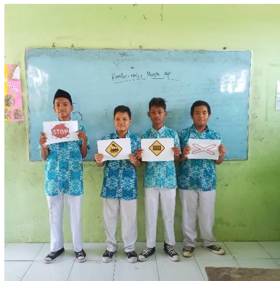
Gambar 6. Siswa memegang rambu-rambu.

Gambar di atas adalah salah satu contoh perlintasan kereta api, yaitu perlintasan sebidang yang terdapat di salah satu daerah di Kabupaten Karanganyar. Rambu-rambu yang terdapat pada perlintasan sebidang di atas di antaranya adalah rambu perlintasan kereta api jalur ganda, rambu dilarang jalan terus, dan rambu perlintasan kereta api dengan palang pintu.