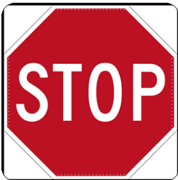
Gambar 3. Rambu dilarang jalan terus