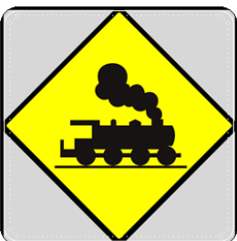
Gambar 4. Perlintasan kereta api tanpa palang pintu

Gambar 1-4 di atas adalah rambu-rambu yang terdapat pada perlintasan kereta api. Perlintasan kereta api tidak selalu memiliki palang pintu, sehingga sebagai masyarakat yang melewati perlintasan kereta api haruslah lebih berhati-hati dalam melintasi jalur kereta api.