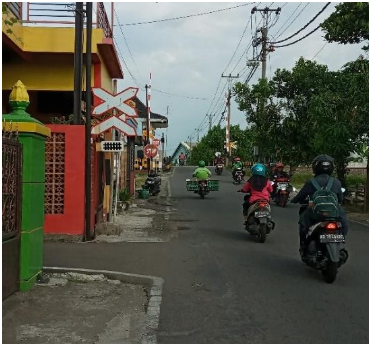
Gambar 5. Perlintasan sebidang.

dilakukan sosialisasi mengenai rambu-rambu tersebut, siswa mengerti dan memahami arti atau maksud dari rambu-rambu yang terdapat pada perlintasan sebidang.